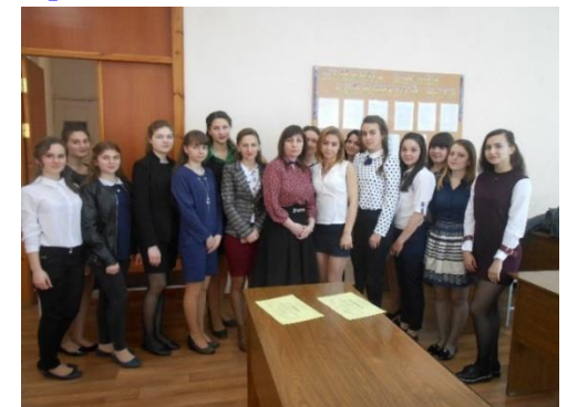
Конферинца студенцэскэ 2017

Децинэторий дипломей де личенцэ ышь пот континуа студииле ла чиклул II де ынвэцэмынт – студий университетаре де мастерат.