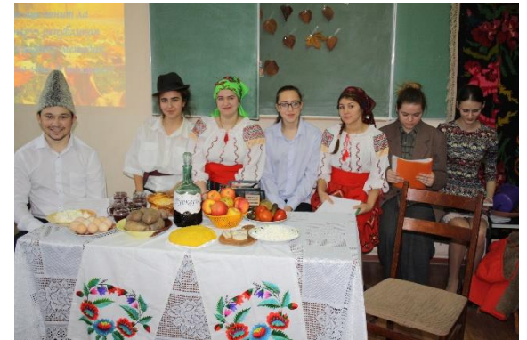
Семинарул републикан штиинцифико-методик